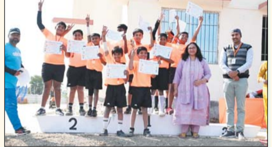
संवाददाता रोजनामा इंडो गुल्फ मो. अबु बकर सिद्दीकी