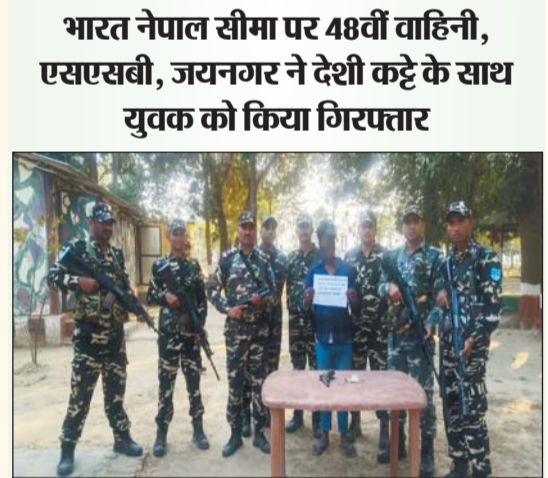
संवाददाता रोजनामा इंडो गुल्फ मो. अबु बकर सिद्दीकी

भारत नेपाल सीमा पर 48वीं वाहिनी, एसएसबी, जयनगर ने देशी कट्टे का थुक को किया गिरफ्तार