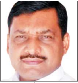
संवाददाता रोजनामा इंडो गल्फ

बिहार में जंगलराज, विपक्षी सांसद भी असुरक्षित, दोषियों की हो अविनाश गिरफ्तारी