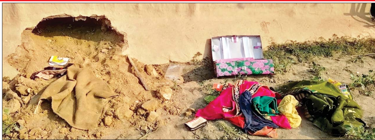
असफल रहा. पीड़ित गृहस्वामि ने कहा कि करीब ढाई लाख की चोरी कर ली गयी है. वहीं सूचना मिलते ही थाने की पुलिस घटना स्थल पर पहुंचकर जांच