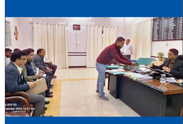
होने का निर्देश दिया गया। जिला पदाधिकारी अमन समीर ने कहा कि लोक शिकायतों का ससमय तथा गुणवत्तापूर्ण निवारण अत्यावश्यक है। लोक प्राधिकारों को तत्परता प्रदर्शित करनी होगी। उन्होंने कहा कि बिहार

जिला संवाददाता रोजनामा इंडो गल्फ शकील हैदर बिहार लोक शिकायत निवारण अधिकार अधिनियम-2015 का सफल क्रियान्वयन प्रशासन की सर्वोच्च प्राथमिकता; सभी पदाधिकारी इसके लिए सजग, संवेदनशील तथा सक्रिय रहें: जिला पदाधिकारी जिलाधिकारी, सारण अमन समीर के द्वारा आज कार्यालय कक्ष में बिहार लोक शिकायत निवारण अधिकार अधिनियम, 2015 के तहत द्वितीय औपचारिक शिकायतों की सुनवाई की गई और शिकायत का निवारण किया गया। जिला पदाधिकारी द्वारा आज लोक शिकायत के कुल 13 मामलों की सुनवाई की गई जिसमें 04 मामले में अंतिम रूप से आदेश पारित किया गया तथा शेष 09 मामले में पूर्ण प्रतिवेदन के साथ अगली तिथि पर लोक प्राधिकार को उपस्थित