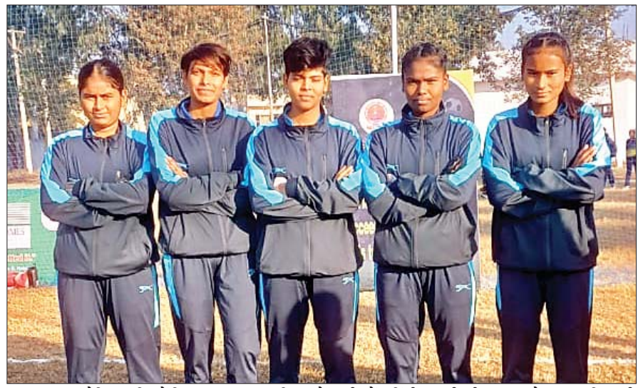
2024 तक आयोजित था जिसमें बिहार के विभिन्न जिलों की 18 खिलाड़ी