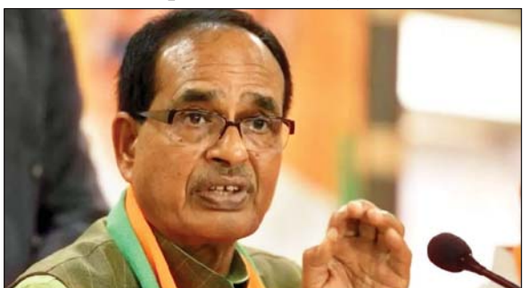
सिफारिशें दी थीं। न्यूनतम समर्थन मूल्य (एमएसपी) को उत्पादन की वेटेड औसत लागत से कम से कम 50 प्रतिशत

नई दिल्ली: किसानों के दिल्ली मार्च के बीच केन्द्रीय कृषि मंत्री शिवराज चौहान ने बड़ा बयान दिया है। उन्होंने संसद में कहा कि सभी कृषि उपजों के लिए केन्द्र सरकार न्यूनतम टह देगी। अपने संबोधन में केन्द्रीय मंत्री ने विपक्ष पर जमकर निशाना साधा। उन्होंने कहा कि जब वे (कांग्रेस) सत्ता में थी तो उन्होंने एमएस स्वामीनाथन आयोग की सिफारिश को खारिज कर दिया था। इतना ही नहीं, साल 2006 में डॉ. एमएस स्वामीनाथन की अध्यक्षता में राष्ट्रीय किसान आयोग (एनसीएफ) ने कई