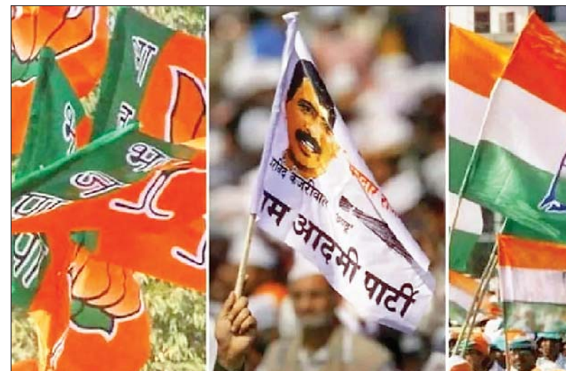
चुके हैं। बीजेपी अपने पूर्व सांसदों को चुनाव मैदान में उतारेगी बीजेपी आगामी विधानसभा चुनाव में