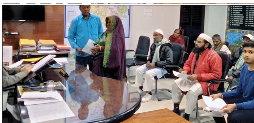
मो.सदरे आलम नोमानी सौतामढ़ी: जिलाधिकारी सौतामढ़ी, रिचो पाण्डेय ने समाहरणालय स्थित अपने कार्यालय कक्ष में आयोजित जनता दरबार कार्यक्रम में परिवारियों से मिलकर उनके समस्याओं को सुना। जिलाधिकारी द्वारा बारी-बारी से सभी परिवारियों से मुलाकात की गई एवं उनके समस्याओं को सुना गया।