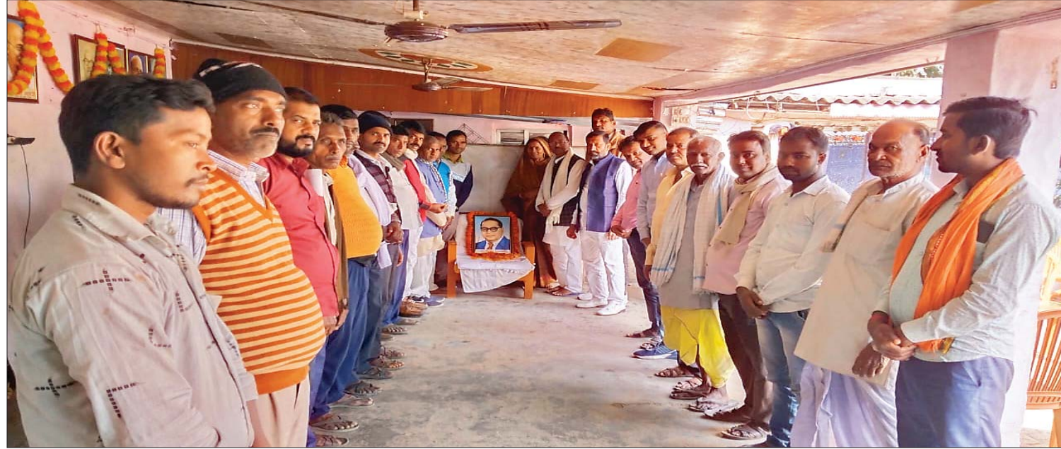
जिला संवाददाता रोजनामा इंडो गल्फ एम नईमुद्दीन आजाद

समस्तीपुर। शुक्रवार को मोरवा विधानसभा अंतर्गत लसकारा वार्ड संख्या एक में राष्ट्रीय लोक मोर्चा के