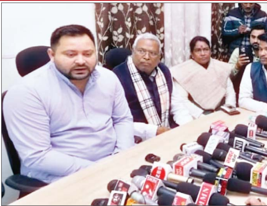
विद्यार्थियों से संवाद स्थापित करना उनके एवं उनकी अनेक दलों की सरकार के लिए कठिन है? क्या

पटना: पटना में नॉर्मलाइजेशन के खिलाफ प्रदर्शन कर रहे छात्रों पर हुए पुलिस लाठीचार्ज पर नेता प्रतिपक्ष तेजस्वी यादव ने नीतीश सरकार को घेरा है। तेजस्वी ने बिहार की एनडीए सरकार से पांच सवाल पूछे हैं। उन्होंने नीतीश की संवाद यात्रा पर भी सवाल खड़े किए हैं। पुलिस लाठीचार्ज को निंदनीय, आपत्तिजनक और बर्बरतापूर्ण बताया है। आपको बता दें बीपीएससी अर्थार्थियों पर हुए लाठीचार्ज में कई छात्रों को चोट आई है। तेजस्वी यादव ने एक्स पर पोस्ट करते हुए लिखा कि आज पटना में इडर अर्थार्थियों पर बिल्कुल ही निंदनीय, आपत्तिजनक एवं बर्बरतापूर्ण लाठीचार्ज हुआ है, जो भाजपा-नीतीश सरकार के अहंकार और अफसरशाही के तानाशाही का प्रतीक है। मुझमें 5 सवाल हैं: 1. लाठीचार्ज के तथ्यांकित दिखावटी 'संवाद' यात्रा पर निकलने से पूर्व यह जांचबंद कि क्या बिहार के वर्तमान व भविष्य, बिहार के