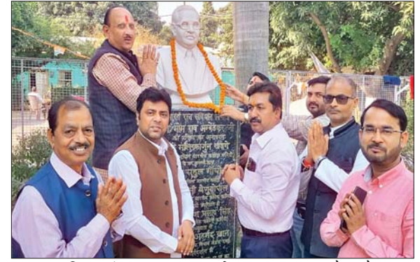
जिला संवाददाता रोजनामा इंडो गल्फ कांग्रेस ने मनाया बाबा साहेब का महापरिनिर्वाण दिवस, संविधान की रक्षा की बात दोहराई