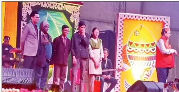
जिला संवाददाता रोजनामा इंडो गल्फ मो. अबु बकर सिद्दीकी

मधुबनी *जिला स्थापना दिवस सह मधुबनी महोत्सव 2024 के अवसर पर वॉट्सन उच्च विद्यालय के प्रांगण में जल जीवन हरियाली के विषय के ऊपर आयोजित चित्रकला प्रतियोगिता निम्न रूपेण प्रतिभागियों को प्रथम, द्वितीय एवं तृतीय स्थान के लिए चयनित किया गया है। *जिला स्थापना दिवस सह मधुबनी महोत्सव 2024 के अवसर