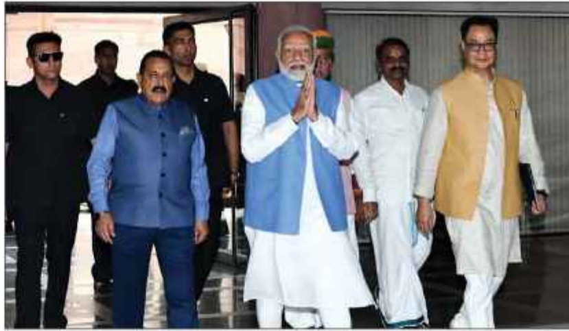
सचिवालय, राइटर्स बिल्डिंग तक मार्च के दौरान हुई।

विरोध रूप से, यह बैठक महत्वपूर्ण है क्योंकि यह विपक्ष के नेता और कांग्रेस सांसद राहुल गांधी की पहली अर्पणित उद्घोषित है। बैठक का उद्देश्य आगामी सत्र के लिए प्रमुख एजेंडे और स्थानियों पर चर्चा करना है। हालांकि, तृणमूल कांग्रेस के सूत्रों ने पुष्टि की कि बैठक में पार्टी का प्रतिनिधित्व नहीं होगा। उन्होंने 21 जुलाई को शहीद दिवस के रूप में उद्घाटन किया, जो 1993 में कोलकाता पुलिस गोलीबारी की घटना के दौरान दुर्घट रूप से मारे गए 13 कांग्रेस समर्थकों की याद में हर साल मनाया जाता है। यह घटना पश्चिम बंगाल में सीपीआई (एम) के नेतृत्व वाली वाम मोर्चा सरकार के तहत घण्ट