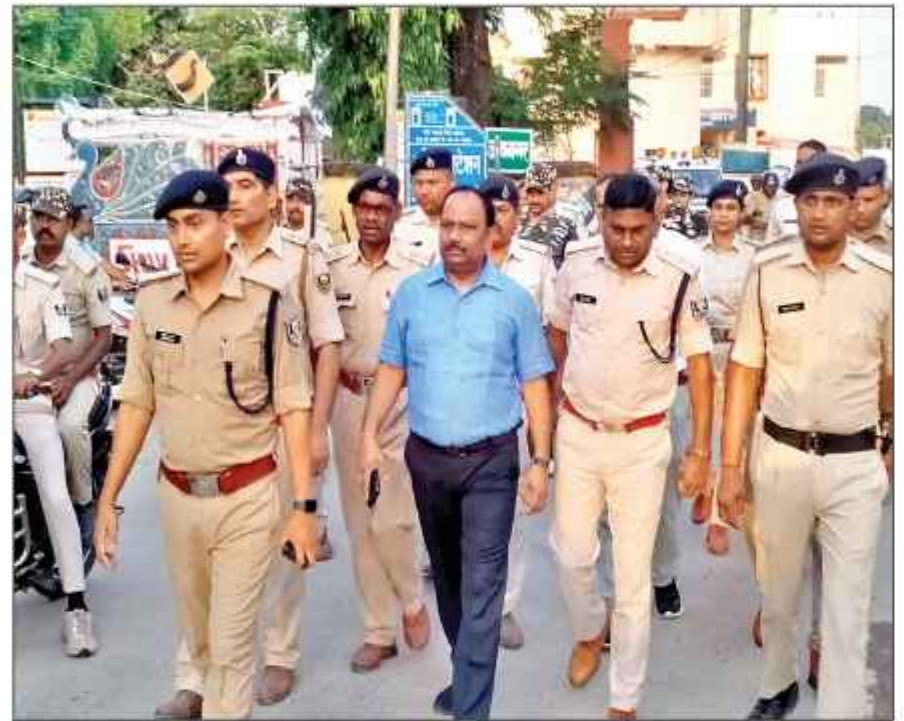
एसडीओ एवं एसडीपीओ जयनगर के नेतृत्व में मुहर्रम की पूर्व संध्या पर फ्लैग मार्च निकाला गया।