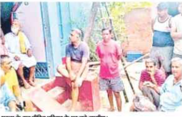
घटना के बाद पीड़ित परिवार के घर जुटे बानीयों।