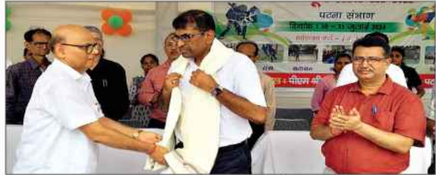
संवाददाता रोजनामा इंडो गल्फ पटना: पीएम श्री केन्द्रीय विद्यालय बेली रोड, पटना में 53वें संभाग स्तरीय खेल-कूद प्रतियोगिता का शुभारम्भ अत्यंत ही उल्लासमयी वातावरण में हुआ। 30 एवं 31 जुलाई 2024 तक चलने वाले इस दो दिवसीय प्रतियोगिता का उद्घाटन पटना प्रमंडल के