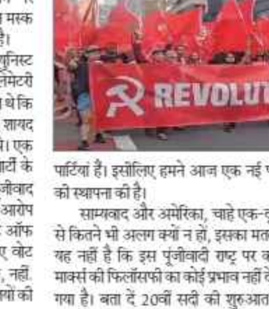
पार्टियां हैं। इसलिए हमने आज एक नई पार्टी की स्थापना की है। साम्यवाद और अमेरिका, चाहे एक-दूसरे से कितने भी अलग क्यों न हों, इसका मतलब यह नहीं है कि इस पूंजीवादी राष्ट्र पर काल करोगे, तो आरसीए हैंडल ने जवाब दिया, नहीं, डेमोक्रेट और रिपब्लिकन दोनों अरबपतियों की

आरसीए सदस्यों ने हथौड़े और दरती का चिन्ह वाले लाल झंडे दिखाते हुए फिलाडेल्फिया की सड़कों पर मार्च किया। जैस-जैस मार्च आगे बढ़ व्लास वॉर 2024 का नारा गुंन उठा। आरसीए के मार्च वीडियो पर एलन मस्क ने कड़ी प्रतिक्रिया दी है। आरसीए ने अपने हैंडल से मार्च का वीडियो शेयर किया, जिसके कैप्शन में लिखा था, अरबपति परजीवी है। एलन मस्क ने आरसीए मार्च के वीडियो कैप्शन पर हैरानी जताई और कॉमेंट सेक्शन में एक एक्सक्लोजेटरी मार्क पोस्ट किया। बता दें कि संसल मीडिया प्लेटफॉर्म एक्स के मालिक एलन मस्क हैं, जिनकी गिनती दुनिया के सबसे अमीर उद्योगपतियों में होती है। शायद एक