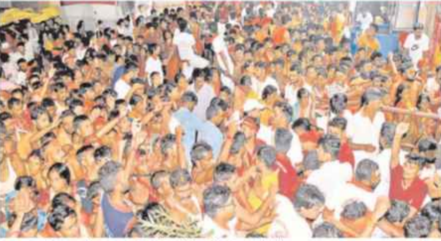
मुजफ्फरपुर के बाबा गरीबनाथ धाम मंदिर में जलाभिषेक को जुटी मरठों की भीड़।

रामों के बीच भी जलाभिषेक करने के लिए कांवरिये कतार में डटे रहे। गरीबनाथ सेवा मंच के कांवरिया सेवा शिविर का उद्घाटन सकरी और तुर्की के बीच किया गया। मंच के मुख्य संरक्षक अरविंद अकेला ने बताया कि शिविर में भोजन, पानी, फलहारी आदि की व्यवस्था की गई है। मौके पर उद्घाटन सकरी और तुर्की के बीच किया गया। मंच के मुख्य