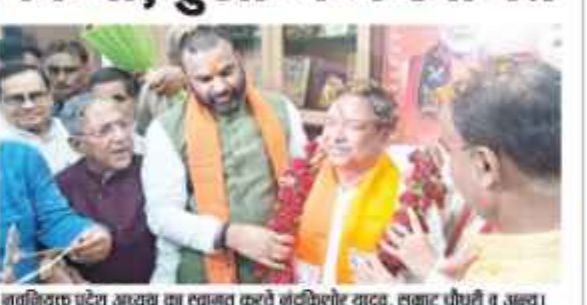
मल्लिगुफ्ट प्रदेश अध्यक्ष का स्वागत करते मल्लिगुफ्ट वरद, सभाट चौधरी व अन्य।

AGENCY PATNA : बिहार प्रदेश भारतीय जनता पार्टी (भाजपा) के नवनिर्वाचित प्रदेश अध्यक्ष दिलीप जयसवाल का सोमवार को दिल्ली से पटना पहुंचने पर भव्य स्वागत किया गया। मल्लि स्वगत के बाद दिलीप जयसवाल ने भाजपा कार्यालय में अपना पदभार ग्रहण कर लिया है। भाजपा कार्यालय में उन्हें चांदी का मुकुट भी पहनाया गया है। पार्टी कार्यालय में स्वागत की जनरल देवारी की गई है। बड़ी संख्या में महिला कार्यकर्ता भी पहुंची हैं। लोक-नगड़े से उनका बार्द स्वागत किया गया। इससे पहले दिलीप जयसवाल दिल्ली से पटना एयरपोर्ट पहुंचे। वहां स्वागत के लिए डिप्टी सीएम विजय सिन्हा और सभाट चौधरी भी पहुंचे थे। एक ही मंजूर पर नए प्रदेश अध्यक्ष समेत दोनों डिप्टी सीएम भी नजर आए। पटना एयरपोर्ट से भाजपा कार्यालय के बीच कई जगहों पर स्वागत भी