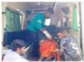
सीएम ने जताया शोक

में मासम फसर गया है। राजा जनकरी के मुताबिक सभी मृतक मुजफ्फरपुर जिले के मोतीपुर नगर परिषद क्षेत्र के वाई संख्या 12 साइडवर्क गांव निवासी बताए गए हैं। घटना में अटो चालक पति-पत्नी की भी मौत हो गई है। एक अन्य घायल ने पीएमसीएच में तोड़ा दम। हादसे में अब तक 6 लोगों की मौत हो चुकी है।