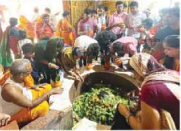
अररिया में पूजा-अर्चना करते श्रद्धालु।

AGENCY ARARIYA : सावन माह के दूसरे सोमवारी पर फारसिगंज और अररिया जिलेभर के सभी शिवालयों में श्रद्धालुओं का सैलाब उमड़ पड़ा। अहले सुबह से ही मंदिरों में श्रद्धालुओं की भीड़ उमड़ने लग गयी। भक्तों ने विधि-विधान के साथ भगवान भोलेनाथ की पूजा-अर्चना किया। भगवान शिव का रुद्राभिषेक व जलाभिषेक कर भक्तों ने परिवार को खुशहाली का आशीर्वाद मांगा। वहीं श्रद्धालुओं का अधिक भीड़ होने के चलते कई मंदिरों में लाइन लगवाकर पूजा-अर्चना करवाया गया। जबकि पूजा-दर्शन को श्रद्धालुओं को इंतजार भी करना पड़ा। इस दौरान शहर के शिवालय, पंचमुखी शिव मंदिर, सुन्दरनाथ धाम के अलावे अन्य मंदिरों में भी भगवान शिव का आशीर्ष पाने के लिए श्रद्धालुओं की भीड़ उमड़ पड़ी। इस दौरान शिवालयों श्रद्धालुओं के जयकारों से गूंजते रहे। हर-हर, बम-बम का घोष सुनयी दिया। कई मंदिरों के आस-पास पूजा सामग्री आदि के लिए दुकानें भी सजी थी। इन दुकानों से श्रद्धालुओं ने वेल पत्र, पुष्प और धतूरा, प्रसाद आदि की खरीदारी की। कई मंदिरों में देर शाम में बुराण पूजा व भजन कौर्तन कार्यक्रम का भी आयोजन हुआ।