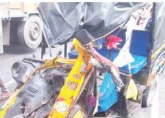
हादसे के बाद खतिबलस वाहन।

AGENCY HAJIPUR : बिहार के वैशाली जिले में भीषण सड़क हादसा हुआ है। जिसमें मौके पर ही दो महिलाओं की मौत हो गई। जबकि दो महिलाओं समेत चार लोगों ने इलाज के दौरान अस्पताल में दम तोड़ दिया। बताया जा रहा है कि वैशाली थाना क्षेत्र के कोल्ड स्टोरेज के पास टुक और अटो की जोरदार टक्कर हुई। इस टक्कर में अटो के परखच्चे उड़ गए। जिसमें 5 महिलाओं समेत 6 लोगों की मौत हो गई। अटो में सवार सभी लोग सभी बुधिया मईया मंदिर से पुजफरपुर लौट रहे थे। मृतकों में कई महिलाएं मोतीपुर बखरा की रहने वाली हैं। अटो में कुल 9 लोग सवार थे। मृतकों के परिवार