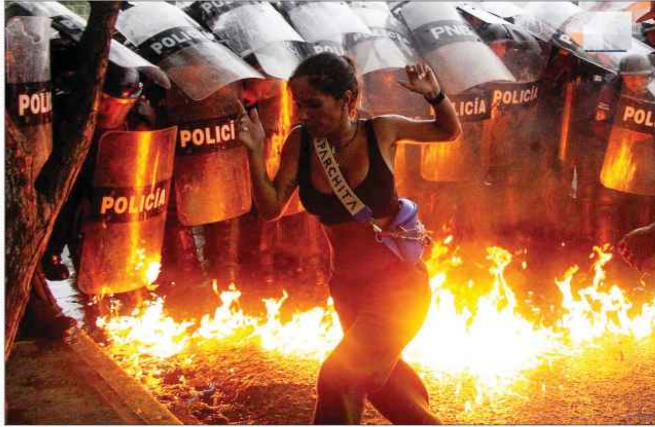
वेनेजुएला में चुनाव परिणामों के बाद से ही प्रदर्शन जारी है। इसी दौरान सुरक्षा बलों के सामने एक मोलोटोव कोकटेल गिरने से आग लग गयी।

अनुसार पीएम फिको ने एक वीडियो संदेश में कहा है कि यूक्रेन द्वारा लुकोइल पर लगाए प्रतिबंध को आगे लागू करने से यूक्रेन, स्लोवाकिया और हंगरी को ही नुकसान होगा। उन्होंने कहा कि यदि यूक्रेन के जरिए रूसी तेल की सप्लाई जल्द शुरू नहीं की गई तो स्लोवाकिया की कंपनी स्लोवाकिया जो यूक्रेन को डील की आपूर्ति बंद कर देगी। पीएम फिको ने एक वीडियो संदेश में कहा था कि स्लोवाकिया की ओर से यह चेतावनी है कि हम तैयार हैं। मैं उन रिपोर्टों का स्वागत करता हूँ जो पुष्टि करती हैं कि संबंधित वाणिज्यिक कंपनियों पहले से ही इस तकनीकी समाधान को कम से कम समय में लागू करने पर विचार कर रही हैं।