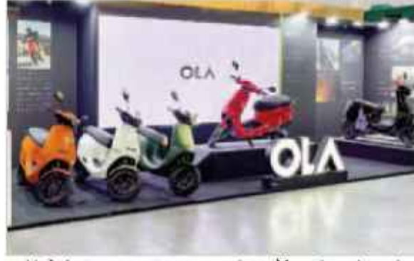
आईपीओ के लिए बाजार नियामक से मंजूरी मिल गई। इस मंजूरी के साथ ही ओला इलेक्ट्रिक के लिए सूचीबद्ध होने वाली पहली भारतीय इलेक्ट्रिक वाहन कंपनी बनने की यह आसना हो गई है।

रखा है। सूत्रों के मुताबिक सॉफ्टवेक समर्थित ईवी निर्माता को आईपीओ से करीब 4.5 अरब डॉलर का मूल्यांकन की संभावना है जो इसके पिछले फंडिंग राउंड के लगभग 5.5 अरब डॉलर के मूल्यांकन से लगभग 18 प्रतिशत कम है। कंपनी एथर एनर्जी, बजाज और टीवीएस मोटर कंपनी के साथ प्रतिस्पर्धा करती है। ओला इलेक्ट्रिक ने 22 दिसंबर, 2023 को सेबी के पास अपना डीआरएफपी जमा कराया था। 20 जून को ओला इलेक्ट्रिक को