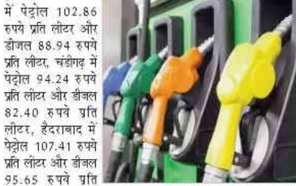
पटना में पेट्रोल 105.18 रुपये प्रति लीटर और डीजल 92.04 रुपये प्रति लीटर बिक रहा है।

103.44 रुपये प्रति लीटर और डीजल की कीमत 89.97 रुपये प्रति लीटर, कोलकाता में पेट्रोल की कीमत 104.95 रुपये प्रति लीटर और डीजल 91.76 रुपये प्रति लीटर और चेन्नई में पेट्रोल की कीमत 100.75 रुपये प्रति लीटर और डीजल की कीमत 92.34 रुपये प्रति लीटर है। वहीं नोएडा में पेट्रोल 94.83 रुपये प्रति लीटर और डीजल 87.96 रुपये प्रति लीटर, गुरुग्राम में पेट्रोल 95.19 रुपये प्रति लीटर और डीजल 88.05 रुपये प्रति लीटर, कोलार