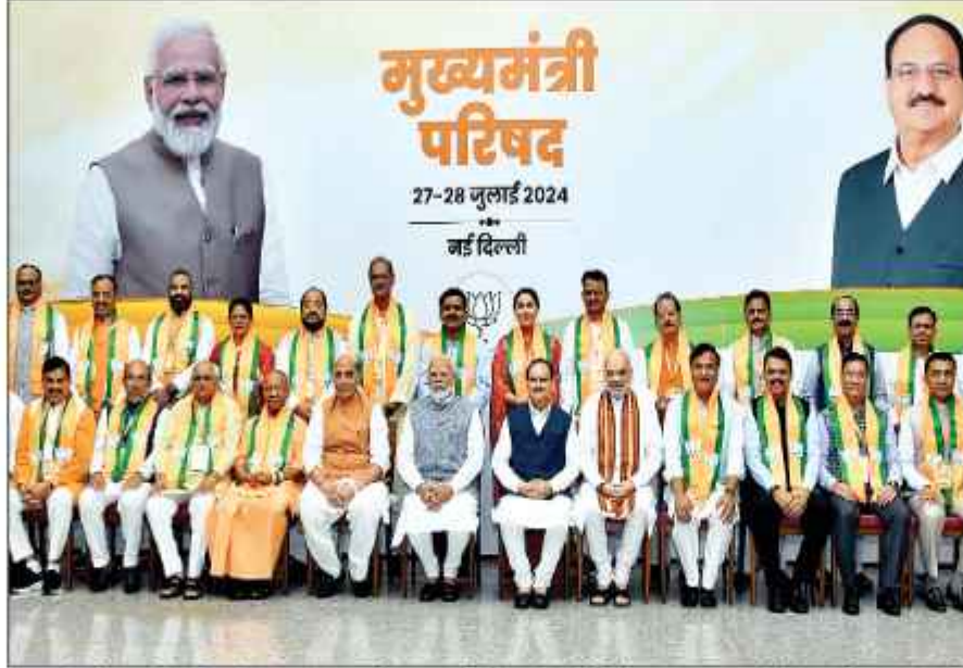
मुख्यमंत्री परिषद 27-28 जुलाई 2024 नई दिल्ली

नई दिल्ली: नया दिल्ली। प्रधानमंत्री नरेंद्र मोदी ने रविवार को कहा कि केंद्र और राज्य सरकारों अधिक मजबूती से लोक कल्याण के समन्वित और मजबूत प्रयासों में जुट जाती हैं तो हाथिकसत भारत का लक्ष्य निश्चित तौर से हासिल किया जा सकता है। पार्टी के वरिष्ठ नेता और भारतीय जनता पार्टी (भाजपा) के सुशासन प्रकॉष्ठ के संयोजक विनय सहस्रबुद्धे की ओर से जारी एक बयान के मुताबिक मोदी ने कहा कि विरासत को विकास करना और विकास को विरासत का निर्माण करना हाथिकसत भारत को संकल्पना में विशेष महत्व रखता है। प्रधानमंत्री यहां भारतीय जनता पार्टी (भाजपा) शासन राज्यों के 13 मुख्यमंत्रियों और 15 उपमुख्यमंत्रियों को दो दिवसीय बैठक के दूसरे दिन उन्हें संबोधित कर रहे थे। मोदी ने देश को 5,000 अरब डॉलर की अर्थव्यवस्था बनाने के अपनी सरकार के एजेंडे के बारे में विस्तार से चर्चा की और कल्याणकारी उपायों में जनता की भागीदारी के महत्व पर जोर दिया। सहस्रबुद्धे ने कहा कि प्रधानमंत्री ने विभिन्न समूहों को लाइव करते हुए