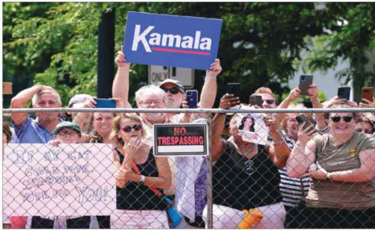
अमेरिका में अमेरिकी उपराष्ट्रपति कमला हैरिस अपने चुनाव अभियान में पहुंची, इस दौरान उनके समर्थक उत्साहित दिखे।

वाशिंगटन। भारतीय अमेरिकी बच्चों का अमेरिका से डिपोर्ट होने का रिस्क बढ़ता जा रहा है। दरअसल, जो बच्चे अपने माता-पिता के साथ छोटी उम्र में अमेरिका आए थे उन्हें डीवयूमेटेड ड्रीमर्स कहा जाता है। हालांकि, जैसे ही इन बच्चों की उम्र 21 साल की हो जाएगी तो वह अपने माता-पिता के वीजा पर निर्भर नहीं रह सकेंगे। अमेरिका के इस कानून के कारण ऐसे बच्चों पर निर्वासित होने का खतरा बढ़ जाता है। ऐसे लगभग 2, 50,000 से अधिक बच्चे हैं, जिसमें भारतीय-अमेरिकी बच्चों की संख्या सबसे अधिक है। दरअसल, अमेरिका से डिपोर्ट किए जाने का सबसे बड़ा कारण - बढ़ती उम्र को बताया गया है। नेशनल फाउंडेशन फॉर अमेरिकन पॉलिसी ने 2 नवंबर तक अमेरिकी नागरिकता और आव्रजन सेवा के आंकड़ों को रटवी किया और पाया कि डिपेंडेंट्स सहित 1.2 मिलियन से अधिक भारतीय वर्तमान में कई कैटेगरी में ग्रीन कार्ड का इंतजार कर रहे हैं। यह संख्या फोर्ब्स की एक रटवी से ली गई है। जानकारी अनुसार, काइल हाउस ने इसके लिए रिफिलिकन को दोषी ठहराया है और कहा है कि उन्होंने दो बार द्वितीय समझौते को खारिज कर दिया था। 13 जून को, आव्रजन, नागरिकता और सीमा सुरक्षा रीजनल न्यायालयिका उपसमिति के अध्यक्ष सीनेटर एलेक्स पैडीला और प्रतिनिधि डेबोरा रॉस के नेतृत्व में 43 सांसदों के एक समूह ने बाइडेन प्रशासन से इस मुद्दे के लिए तत्काल कार्रवाई करने का आग्रह किया।