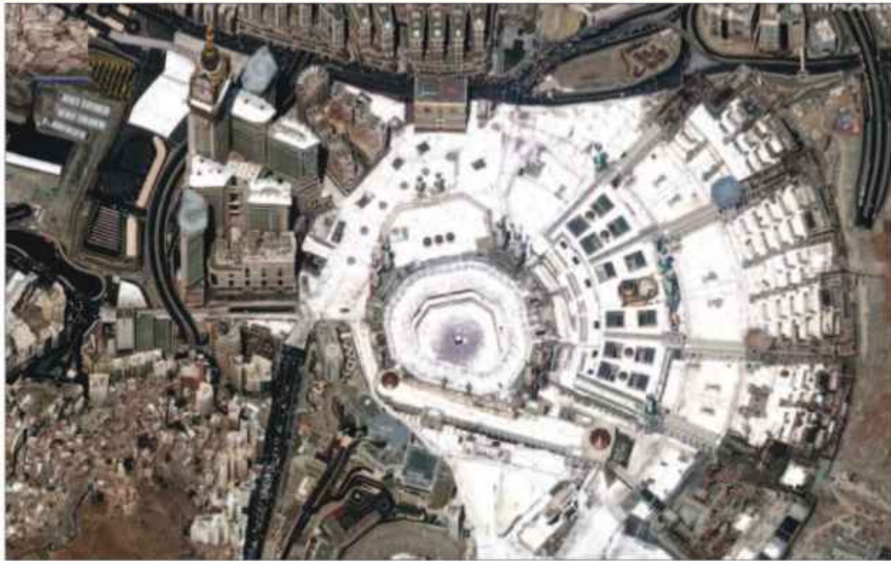
मक्का में हज यात्रा के दौरान मस्जिद की सेटेलाइट के जरिये ली गयी एक तस्वीर।

कीव। रूस और यूक्रेन के बीच चल रही जंग के बीच यूक्रेन ने दावा करते हुए कहा कि जब रिव्दुजलैंड में शांति सम्मेलन चल रहा था तो रूस ने यूक्रेन पर अपने सैन्य हमले तेज कर दिए।